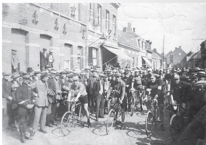
De eerste start in Schoten

Schoten (start om 8 uur langs de Calixbergse Dreef, linksaf over de Deuzeld naar 't Stadion, op de Grote Baan naar 't Fort, de Militaire Baan tot Oude God, Kontich, Mechelen, Aalst, Oudenaarde, Kwaremont, Ronse, Ninove, Vilvoorde, Mechelen, Lier, Emblem, Boechout, Ranst, Wommelgem, Militaire Baan, Wijnegem, langs de Vogelenzang naar 's Gravenwezel, Schoten, twee plaatselijke ronden van 14 km., totaal 275 km.