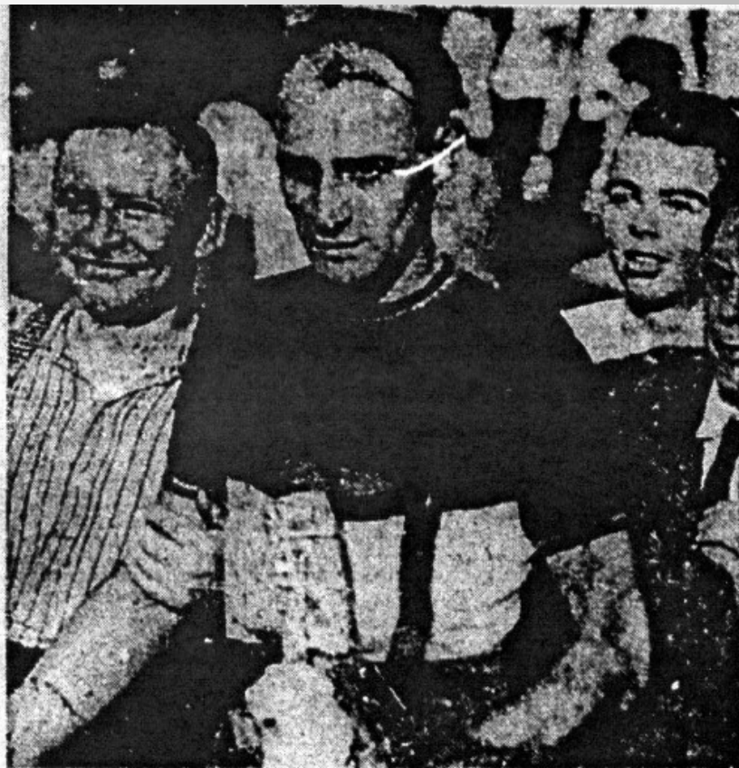
Achiel Buysse deed zijn nationale trui alle eer aan in de Grote Scheldeprijs welke hij overtuigend wist te veroveren.

Schoten, Wijnegem, Borsbeek, Mortsel, Boechout, Lier, Koningshooikt, Heist-op-den-Berg, Booischot, Aarschot, Rillaar, Scherpenheuvel, Diest, Veerle, Geel-Punt, Geel, Kasterlee, Turnhout, Vosselaar, Oostmalle, Westmalle, Schilde, 's-Gravenwezel, Schoten (153 km) en 3 ronden van 17 km, totaal 204 km.