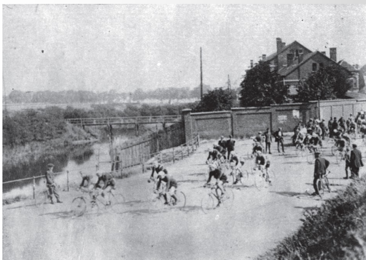
Et voilà, la toute première photo d'action du Prix de l'Escaut. C'est une vue au départ qui a eu lieu à la Rive Gauche, au Vlaamsch Hoofd.

Antwerpen, Sint-Gummarusstraat (départ neutralisé 8 h), Zwijndrecht, Vlaams Hoofd (départ officiel à 9h30), Beveren, Saint-Nicolas, Gand, Deinze, Courtrai (contrôle fixé, arrêter et signer!), Zwevegem, Alost, Dendermonde, Baasrode, Malines, Vélodrome Garden City (2 tours). Total 213 km.