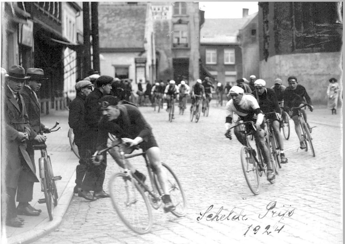
Schelde Prijs 1924